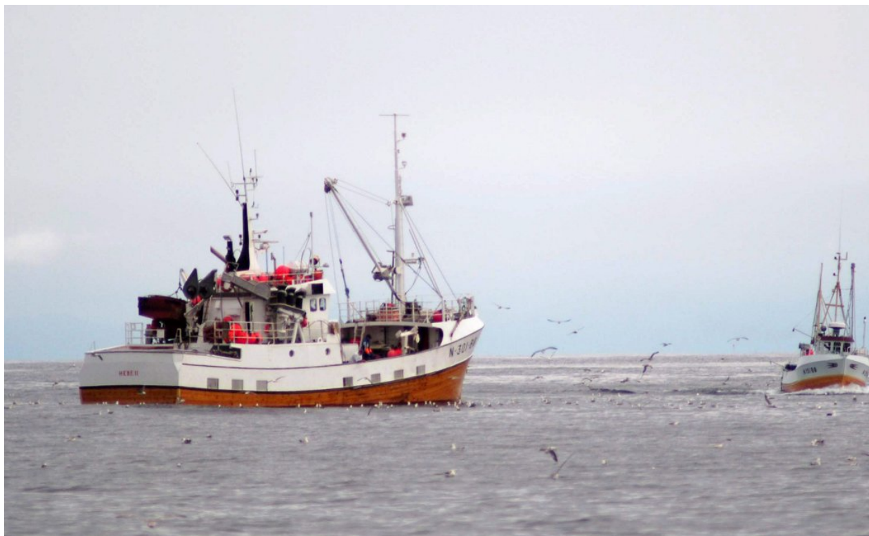
«Hebe II» på Skallen.

bemerkelsesverdig – sett på bakgrunn av kommisjonens sammensetning – kjemisk rensset for folk med bakgrunn i praktisk fiske og fiskeindustri, slik også Tveteraas-utvalget var.